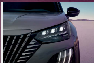
Diseño renovado y distintivo