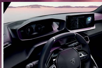
PEUGEOT i-Cockpit® 3D