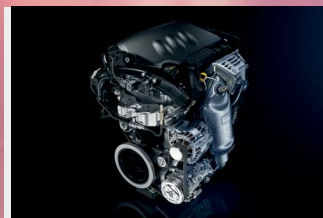
Galardonado motor 1.2 L Puretech Turbo